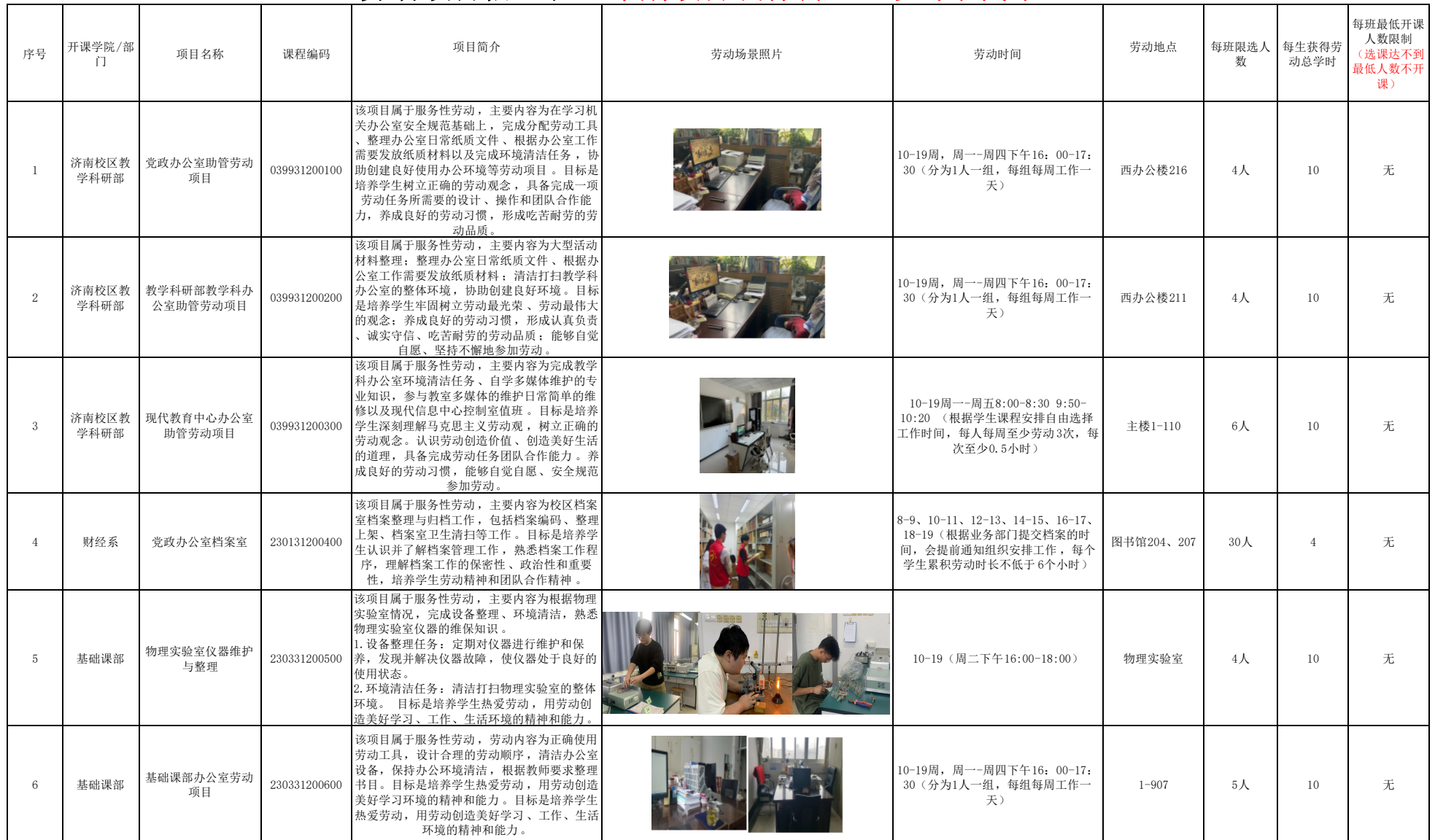
劳动项目信息表（个别项目或有调整，以课表为准）